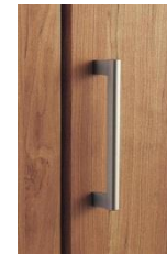
T2型 (丸型取っ手) サテンシルバー色 (塗装)