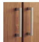
T2型 (丸型取っ手) サテンシルバー色 (塗装)